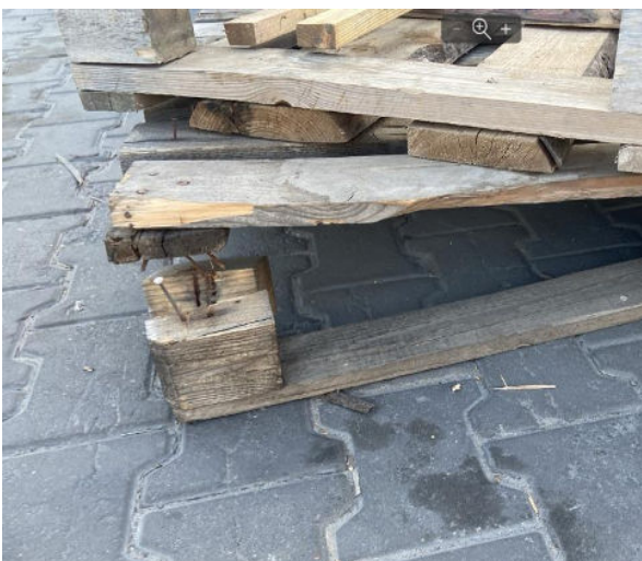
5. На піддоні виламана чи тріснута п'ята