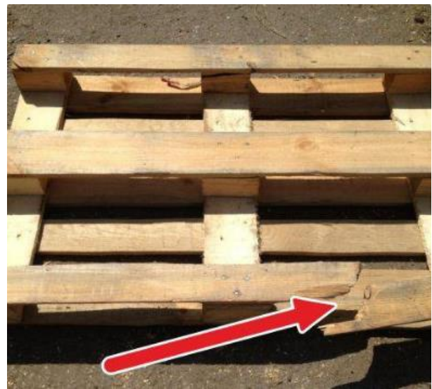
4.Зламана нижня рійка