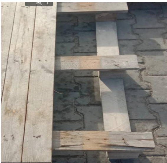
3.Частина піддону виламана